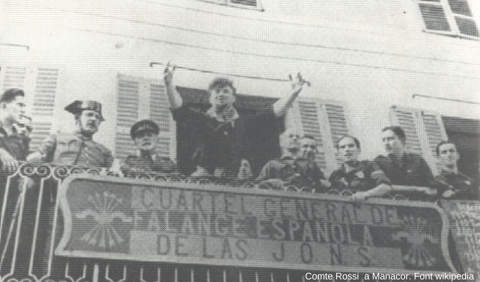
Comte Rossi a Manacor.